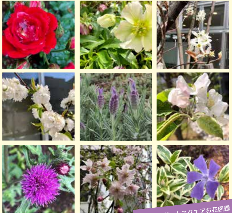
総曲輪レガートスクエアお花図鑑